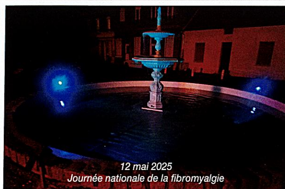
12 mai 2025 Journée nationale de la fibromyalgie